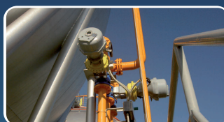
Planta de Energía