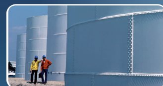
Tratamiento de Agua