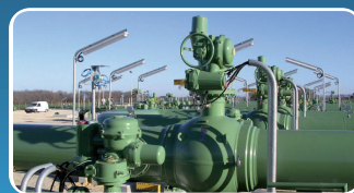
Petróleo y Gas