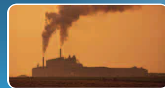
Industria y Construcción